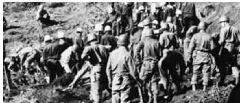
伊豆大島近海地震での自衛隊・県警救助活動(S.53.見高入谷)

総務課長…県下の市町でホームページでPRしている市町があり現在16市町で寄附を受け、どうするかは特典をもうけたり、寄附