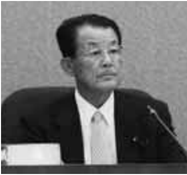
中村 聡 議長