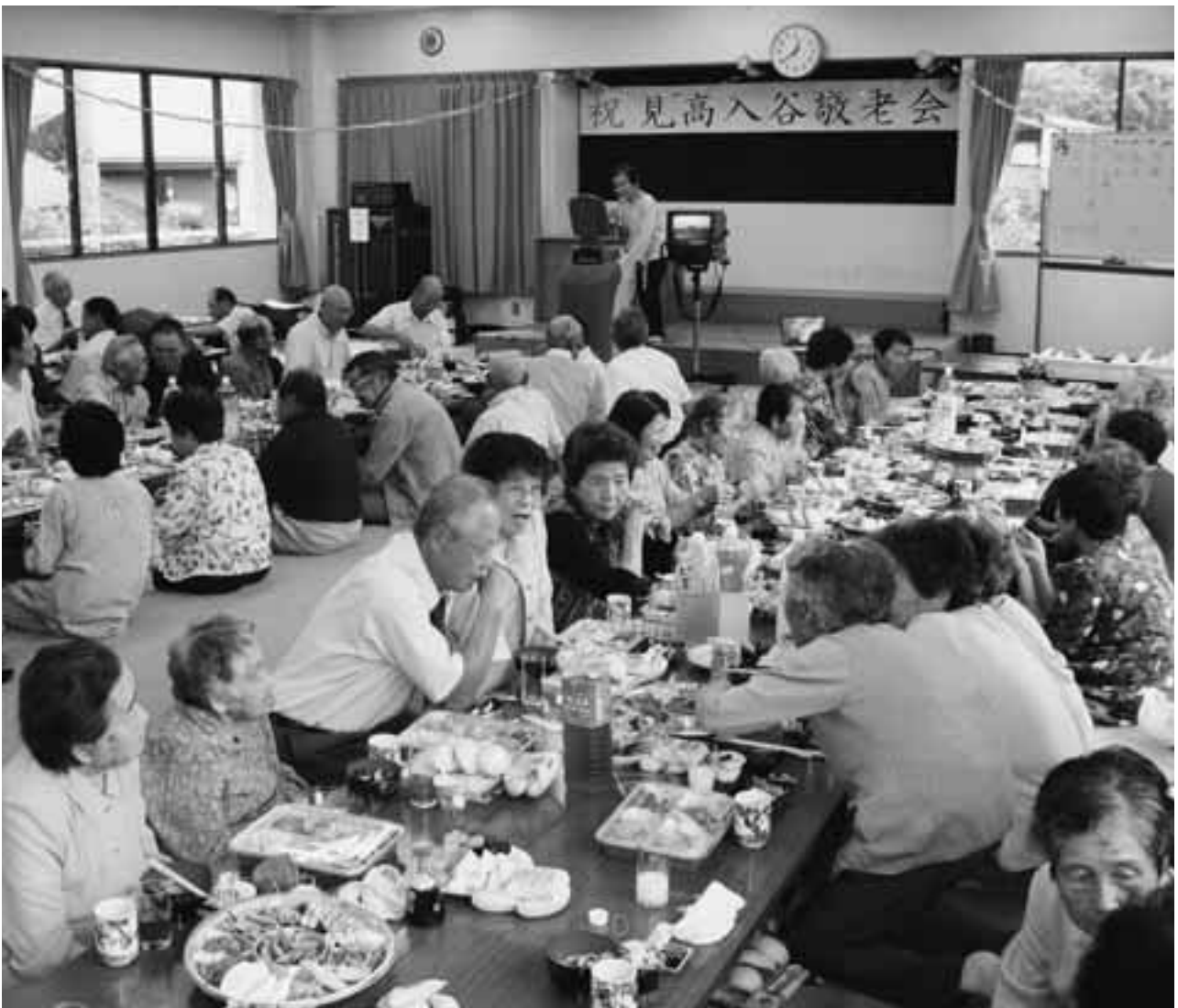
見高入谷区の敬老会風景