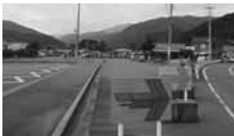
笹原から役場方向へ(中央道)

質問…今後田中バイパスが役場前に接続され、主要道路に位置づけられる事が判っている。逆川から鍛冶屋沢線を通る車と、この田中バイパスを通る車が役場前に集中するのではないかと危惧する。この対策として、河津駅前から笹原文化の