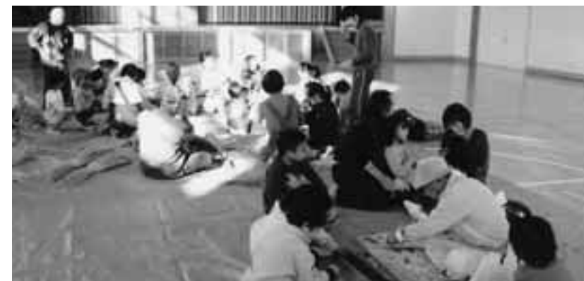
昔遊び体験・正月飾りづくり（ひだまりの会、西小体育館）

町長...地域自治組織での合併を 1市3町で了解している。自治 組織の立ち上げが当町としての 合併の条件である。