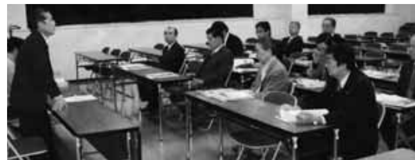
千葉県長生市広域環境センターで研修

会の全員協議会が開かれ、新病院建設や救急医療の在り方などを検討した「共立湊病院改革推進委員会（専門家8名）」の答申について協議し、提言内容について大筋で合意する事を確認した。答申では平成23年3月までに旧下田南高校跡地を第一候補に新病院を建設する事を明示し病床数は現在の150床を前提に、建設費は1坪当たり60万円に抑え、150床規模で約22億円を見込んでいる。賀茂地区の中核病院として一次、二次救急医療体制の充実を目指す一方、賀茂医師会と連携した一次救急の夜間診療体制の構築も答申に盛り込まれている。一方、現在の病院跡地には新たに無床診療所を設置し高齢者に優しい福祉エリアとして活用するプランを示した。運営形態は現在の指定管理者制度による公設民営方式を維持する方針である。経営安定に向けた「常勤医師十人以上の確保」などを指定管理者の条件として設定されている。