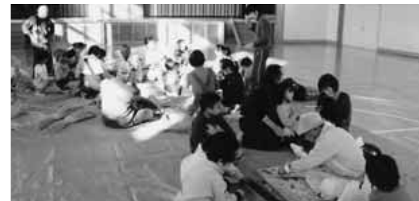
昔遊び体験・正月飾りづくり（ひだまりの会、西小体育館）

町長...地域自治組織での合併を 1市3町で了解している。自治 組織の立ち上げが当町としての 合併の条件である。