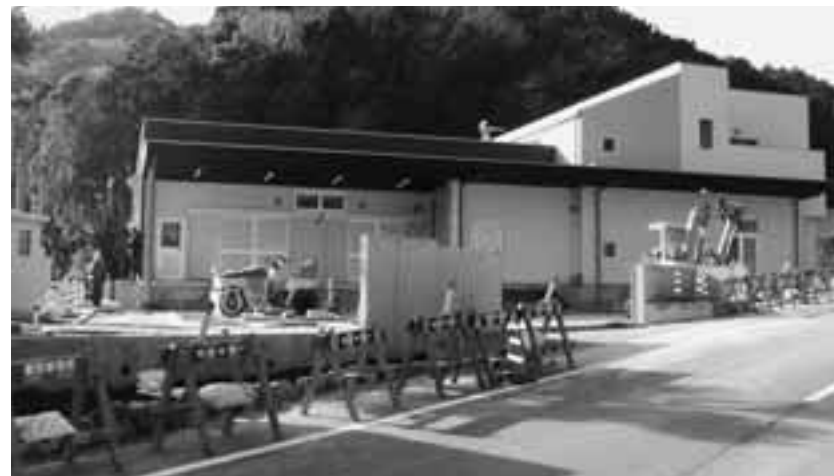
完成間近の河津町学校給食センター