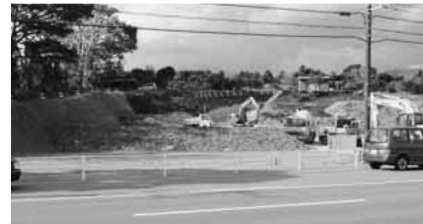
早期完成を旨とする農免道路（長野地区国道への取り付け）

町長...継続的なものとしては、見高の農免道路、21年度中完成を目指す負担金の計上も必要。田中バイパス道路。役場前から峰への道路。観光施策の中での観光交流館の建設。又地元要望から来の宮神社のトイレについては、観光整備費での新設。水道整備での奥原水源の活用。町道泉原線約60mの改良工事。町道の初景橋から約270mの工事を2年間継続で考えている。又国道414号線逆川から峰山トンネルまでが、21年度中で事業が一区切りする。