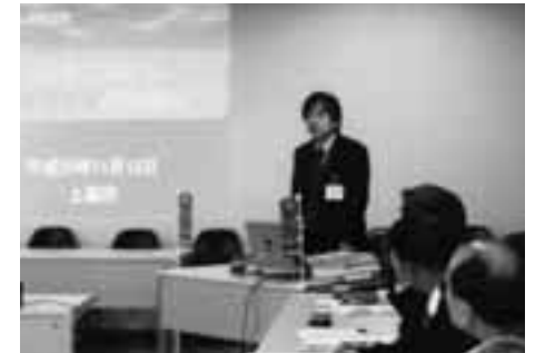
上越市役所での視察研修

当時担当された職員からたくさん資料等をいただき、14市町村と言う大型合併をされた苦労等の説明を受け、これから目ざす合併についての質問も多く出され、大変有意義な視察研修となりました。