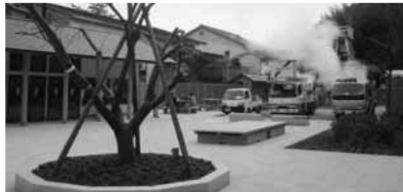
峰温泉大噴湯公園

産業振興課長...正月桜は今年3月卒業のとき小学生に60本記念樹として贈っている。現在60本圃場に植栽してある。今後の成育の状況を見ながら、良い木を探しながら、増殖していく計画。