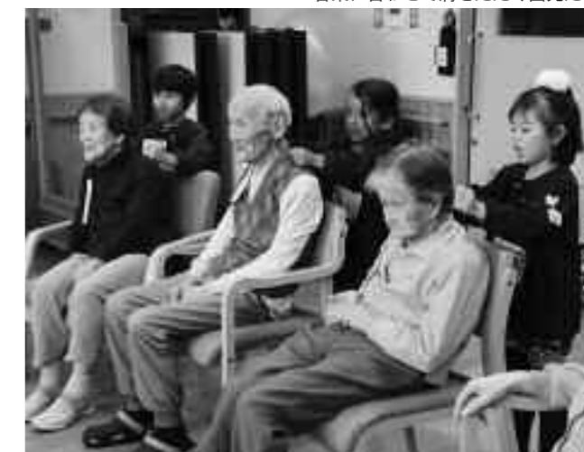
音楽に合わせて肩をたたく園児たち

河津ふれあいまつりが10月26日、河津桜観光交流館駐車場で開かれ、多くの来場者でにぎわいました。会場には地場産品や木工品の販売、健康相談、ゲームコーナーなど29店舗が出店し、寄せ植え講座など多彩なイベントが行われました。また、ステージでは河津町新生総おどり「花こよみ」やフラダンス、楽器演奏などが会場を盛り上げ、最後は「第24代ミス伊豆の踊り子オーディション」で選ばれたミス伊豆の踊り子による恒例の投げもちが行われました。