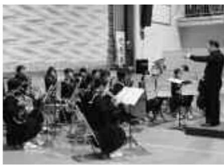
舞台部門の1番手で演奏した河津中吹奏楽部