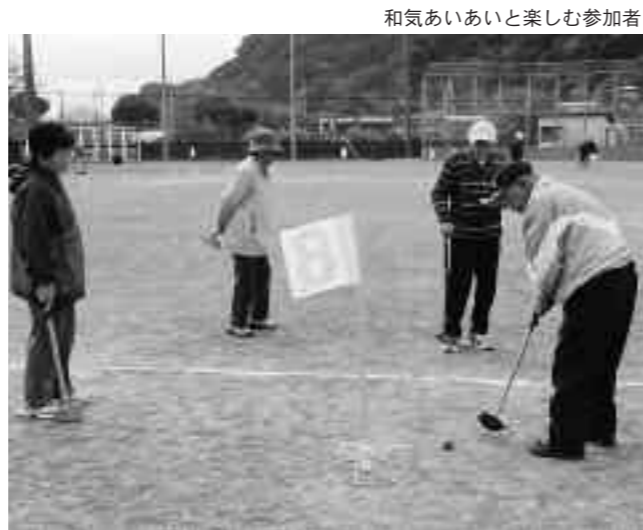
和気あいあいと楽しむ参加者