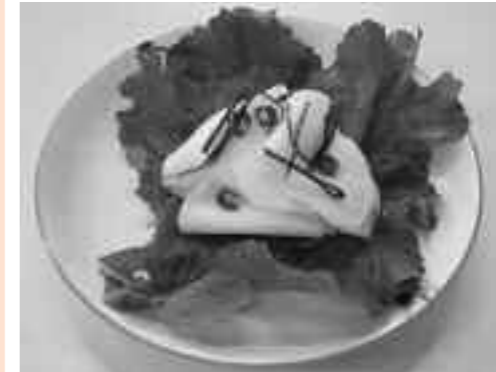
■1人分栄養量(30g分) エネルギー 40kcal 塩分 1g