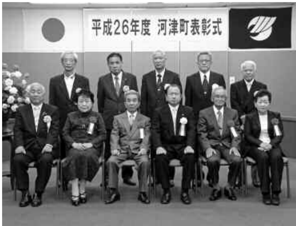
式典後の記念撮影

町表彰式が11月3日、役場議場で行われ、長年にわたり社会福祉の増進や文化的教育の推進など町の振興発展に貢献した4人に町長から表彰状が贈られました。