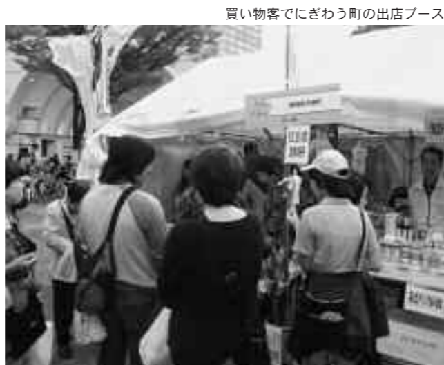
買い物客でにぎわう町の出店ブース