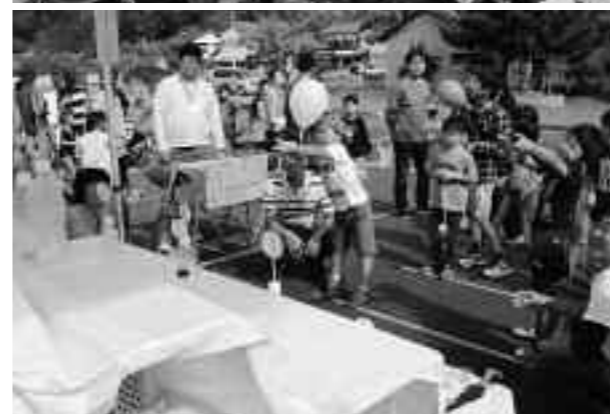
上 歓声が上がったミス伊豆の踊り子らによる投げもち 左 ゲームコーナーの射的に夢中な子どもたち