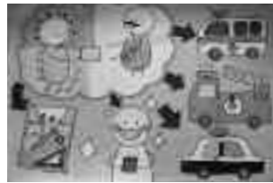
上 ポスターの部、佐藤友美さんの作品 右 習字の部、鈴木明莉さんの作品