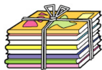
雑誌 (マンガ、チラシ等含む)