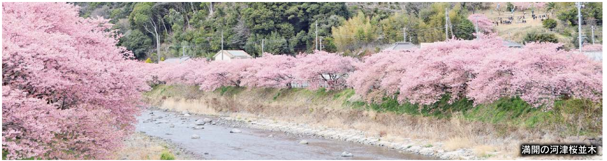
満開の河津桜並木

■予算の基本■ 町の行政を運営する基本的な収入と支出を一般会計といます。これに対して特別会計は、保険料などを扱う特定の事業を行う会計で、国民健康保険事業など5つの会計を設けています。公営企業会計とは水道や温泉など公共の利益を目的にして経営される収入と支出で、独立採算制により運営されています。総額はこれらの会計をすべて合わせた総予算額です。