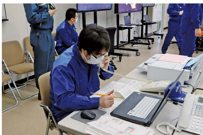
▲被害状況を聞き取る職員

にも大変共通する箇所が多く、教訓とすべき点が多くあると考えている。また、いかに早急に外部からの応援を受け入れるための体制をとれるかが非常に重要だと感じ、訓練の重要性がある」と講評しました。