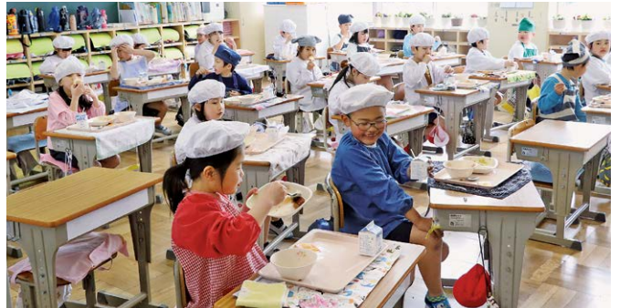
おいしい給食の時間♪ (河津小)