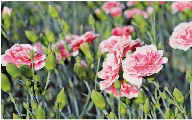
美しく咲くカーネーション