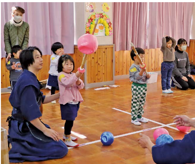
剣道あそびで大盛り上がり！

天心会は、2月27日剣道体験会をさくら幼稚園で開催しました。短めの竹刀でボールを打つあそびや、竹刀の先に載せたペットボトルを落とさないように運ぶあそびを通して、剣道の動きを体験しました。最後には園児と天心会のメンバーによるすり足で走るリレー対決が行われ、園内にはにぎやかな声援が響き渡りました。