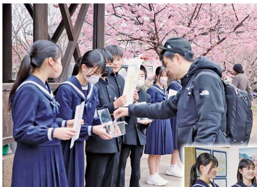
▲桜まつり期間中募金を呼びかける中学生

また、河津中学校生徒会執行部と代表生徒が中心となり、桜まつり期間中、会場を訪れた観光客に向けて募金活動を行うなど、被災された人々の一日も早い日常の復興を願う町民の支援の輪が広がっています。