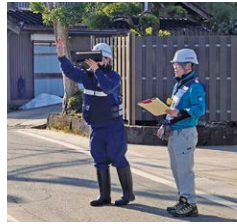
▲他県の職員と連携して作業

発災して4週間たった穴水町は、断水や震度4程度の余震が続き、いまだ地震の被害が目の前に広がる中での調査となりました。今回の住宅の被害認定では、タブレットとシステムを使用することで、公平性とスピードをもって調査することができました。また、人の手の入っていない空き家は全壊・大規模半壊の確率が高く、隣接の住家や水路への流れ込みなど2次被害を出しており、空き家への事前の対策の必要性を強く実感しました。