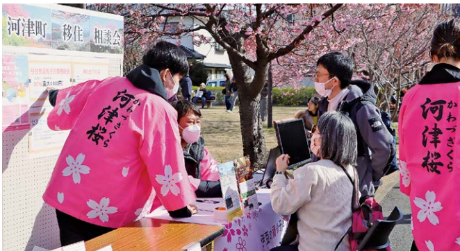
桜まつり期間中開催された移住相談会