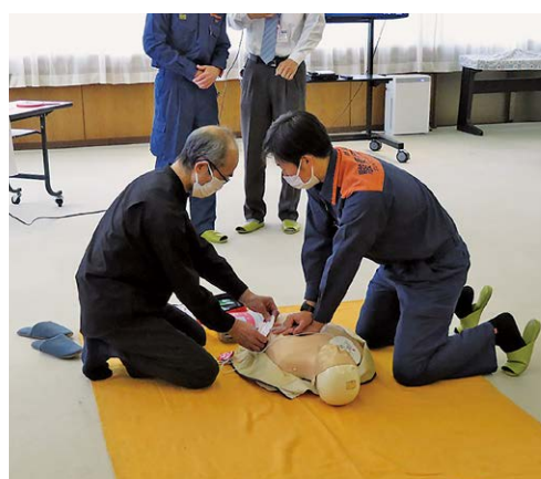
▲AEDの使用方法を体験する参加者

賀茂地区在宅医療・介護連携推進支援センターによる住民講座「いざという時に役立つ救急時の対応や救急搬送の利用について学ぼう」が3月2日、役場ふれあいホールで開催されました。町内、東伊豆町の住民13人が参加し、駿東伊豆消防本部東伊豆消防署の救命救急士から、家族の急変時や災害時の対応や救急搬送の依頼方法、AED（自動対外式除細動器）の使用方法などを学びました。