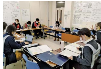
▲日本医師会災害医療チームとのカンファレンス