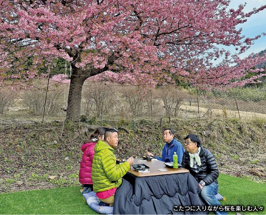
こたつに入りながら桜を楽しむ人々