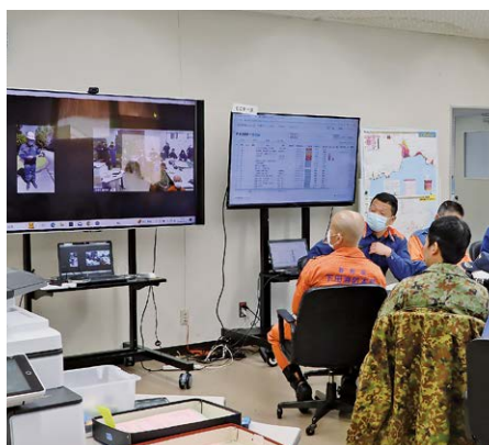
▲Web中継による現地確認