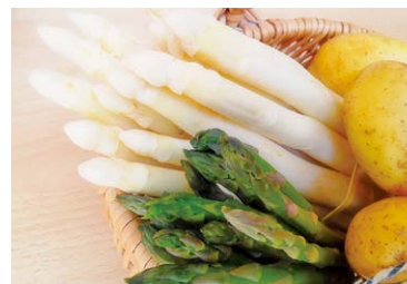
旬野菜を取り入れましょう

④ たけのこ 代表的な春野菜の一部を紹介しましたが、旬の野菜は栄養価が豊富で手に取りやすい価格にもなります。日頃の食生活にぜひ取り入れてみてはいかがでしょうか。