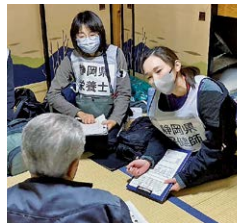
▲避難所入居者の健康相談

二次避難所の白山市の旅館やホテルでの避難生活は、体育館等に比べ格段に生活環境は整ってはいませんが、家族以外の人の同室、施設内に同郷の人が少ない、地元の情報が入りづらい等のデメリットも。被災経験や長引く避難生活は大きなストレスとなり、不眠、気分の落ち込み、高血圧等心身の不調につながっていました。地元から離れた避難所であっても、支援が必要な方が置きざりにならないような健康支援体制が求められると感じました。