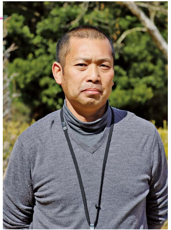
河津バガテル公園