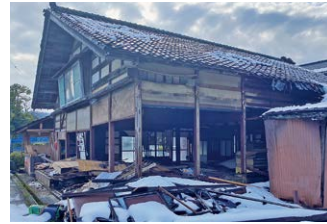
▲雪が残る中での家屋調査