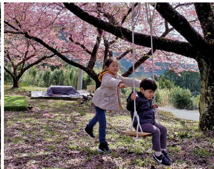
桜の木の下でブランコを楽しむ