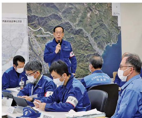
▲講評にて訓練を振り返る