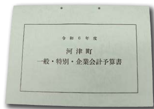
予算書は総務課窓口で閲覧できます

義務的経費は保育所委託事業の減額などにより2637万1千円(前年度比△1.8%)の減額となりました。消費的経費は、公用車購入事業や踊り子温泉会館設備修繕事業などの実施により3407万3千円(前年度比1.6%)の増額となりました。投資的経費は、保健福祉防災センター長寿命化事業や七滝駐車場公衆トイレ整備事業の実施などにより6523万1千円(前年度比7.1%)の増額となりました。