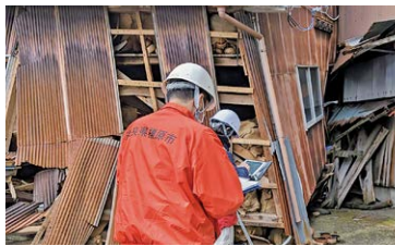
▲被災した家屋の調査を行う