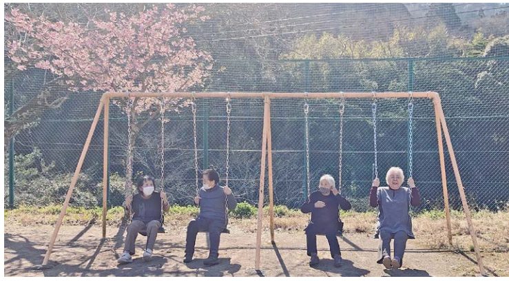
▲2月14日開催介護予防教室