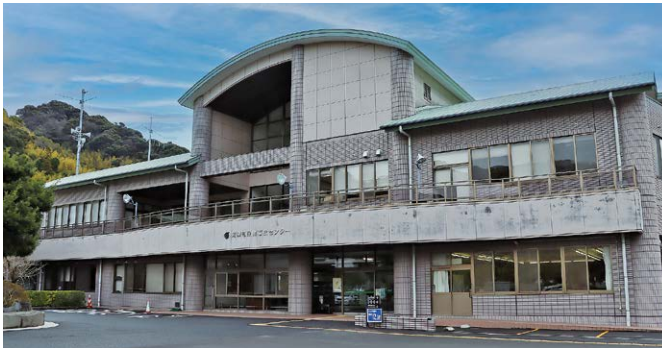
保健福祉防災センター