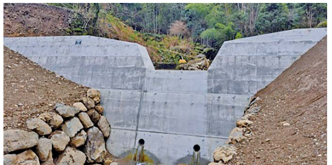
大鍋区星原治山事業