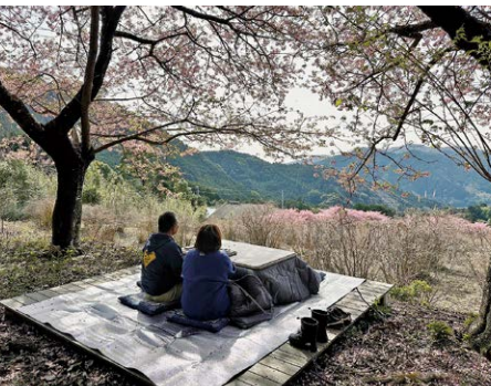
高台から眺める桜

河津ブルーベリーの里で2月24日、3月2日、3日に、こたつに入りながら河津桜を楽しむことができるお花見イベントが開催されました。地域おこし協力隊と上佐ヶ野区有志により企画されたこのイベントでは、見頃を迎えた桜の下にこたつが設置されたほかに、磯部焼など軽食の販売も行われました。イベント期間中は観光客の他にも、地域の家族連れなどが続々と訪れ、こたつに入りながら美しく咲き誇る河津桜をゆっくりと楽しみました。