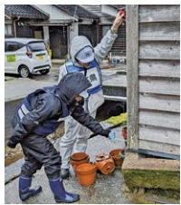
▲傾きや壊れ具合を調査

住宅の倒壊、道路の陥没や隆起は想像以上の被害状況で、発災当時は相当な命の危険を感じたであろうことが容易に想像できました。発災から1か月半が経過してもなお危険箇所は多く、復興には多くの人の協力と時間が必要と感じました。1週間の短い期間の中、1件でも多く調査できるよう、他県の派遣職員と協力し被害認定調査に当たりました。研修では掴めない実務での学び、河津町が被災した際には何か必要かを深く考える機会となりました。