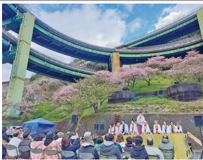
▲河津ループ円形劇場「伊豆の踊子」スペシャル版