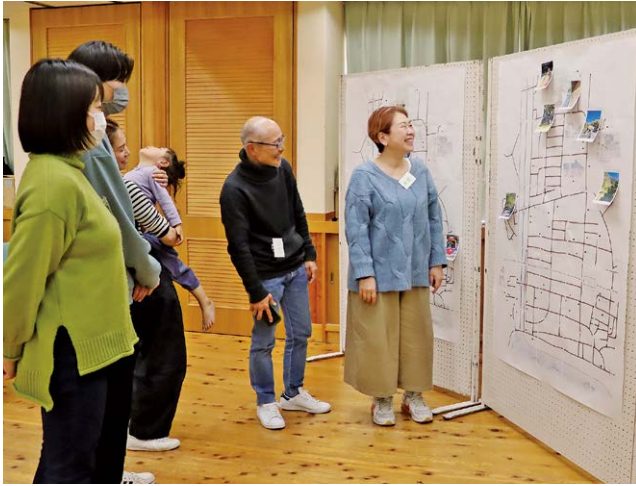
撮影した写真にコメントし合う参加者ら

3月3日、河津を元気に！推進委員会はかわづまちなかフォトウォークを開催しました。地域の魅力の発掘・発信することをねらいとし、参加者は1時間半ほどかけて町内を巡り、神社仏閣や河津川など思い思いに撮影しました。写真撮影後、一人ずつ撮影の意図や工夫を説明し、意見交換をするなど、お互いに町の魅力を共有しました。