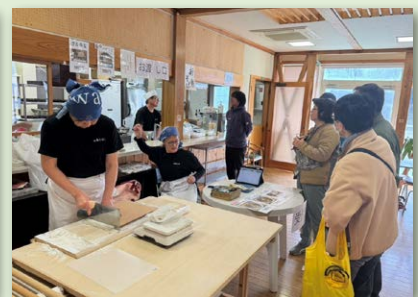
▲新そばのふるまい

12月14日に姉妹都市である河津町で開催された河津寄って軽トラ市テント市に参加しました。白馬村の特産品の販売やそばのふるまいを実施したところ、荒天のなか多くの河津町の皆様にお越しいただきました。3年ぶりの参加となりましたが、河津町の皆様に温かく迎え入れていただき感謝申し上げます。