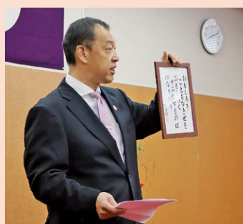
▲職員に訓示を述べる大川町長