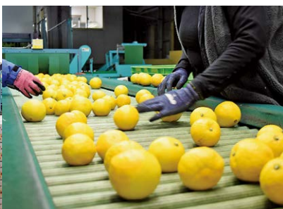
◀ 柑橘共撰場で梱包される

まだ生産が始まって間もないため、部会での勉強会等を行い、産地として品質向上を図っています。JAだけでなく、生産者や町の人々と一緒に「いずのはる」が育っていったら嬉しいです。