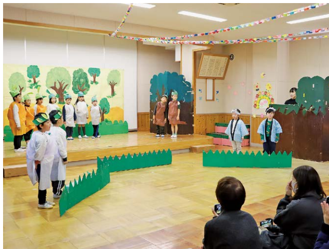
劇「にんじん だいこん ごぼう」で役になりきる園児たち

さくら幼稚園お楽しみ発表会が12月5日に行われました。年少・年中・年長の園児らがオペレッタやお遊戯、合奏など練習の成果を披露しました。年長園児の劇「にんじん だいこん ごぼう」では、役になりきって一生懸命演じる姿が見られました。練習の成果を発揮するかわいらしい園児の姿に、保護者からは大きな拍手が送られました。