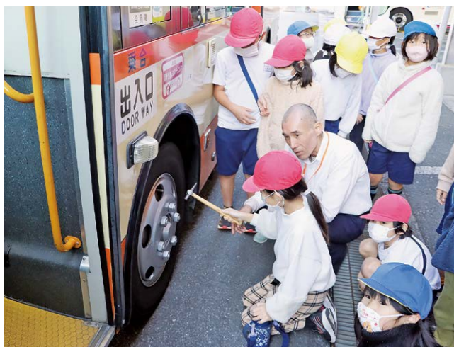
タイヤの点検を体験してみよう

河津小学校2年生を対象にしたバスの乗り方教室が12月11日、東海バス金原車庫にて開催されました。児童は河津小学校からバスに乗り、バス乗車時のマナーや乗り方を学びました。現地に到着すると整備工場や事務所を見学し、タイヤ点検の作業では、一つ一つタイヤを叩いて音に問題がないか確認する体験が行われました。