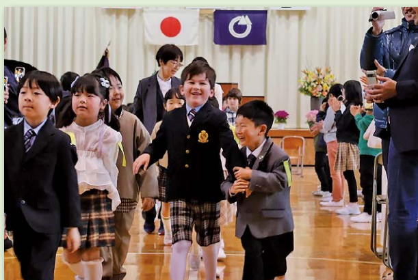
▲希望に満ちた新1年生

保護者の皆様や先生方が見守る中、たくさんの笑顔のあふれる入学式となりました。友達との出会いや勉強、たくさんの行事など、新しい学校生活への期待に胸を膨らませる様子が新入生たちの表情からも感じ取れます。新入生・保護者の皆様、ご入学おめでとうございます。