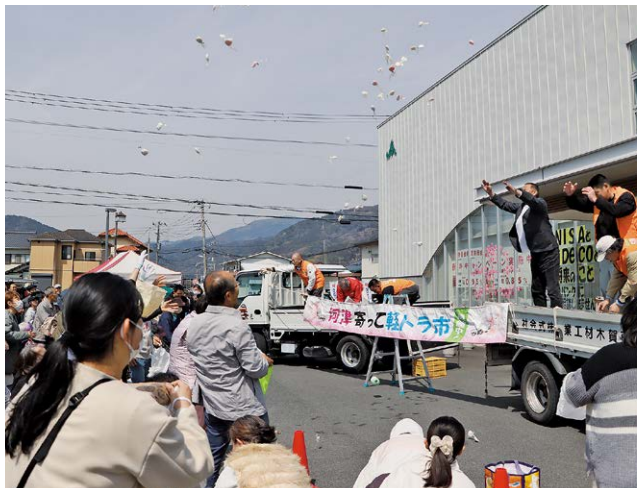
多くの来場者でにぎわう餅まき

第50回河津寄って軽トラ市が3月22日姫宮通りで行われました。当日は、34の事業者、団体が軽自動車やキッチンカーを並べました。来場者は順番に店を回り、希望の商品を品定めしたり馴染みの店で出店者との会話を楽しむ様子が見られました。第50回目の開催を記念した餅まきも行われ、町内外の多くの来場者でにぎわいました。