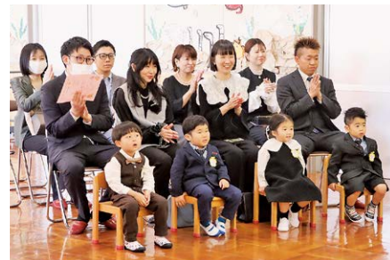
新しい友達との出会いにわくわく