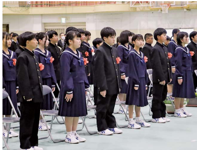
真新しい制服に身を包む新1年生