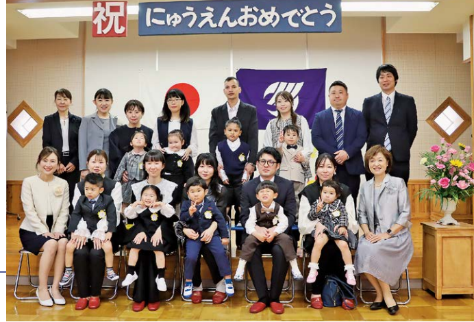
家族も一緒にお祝い（さくら幼稚園 入園式）