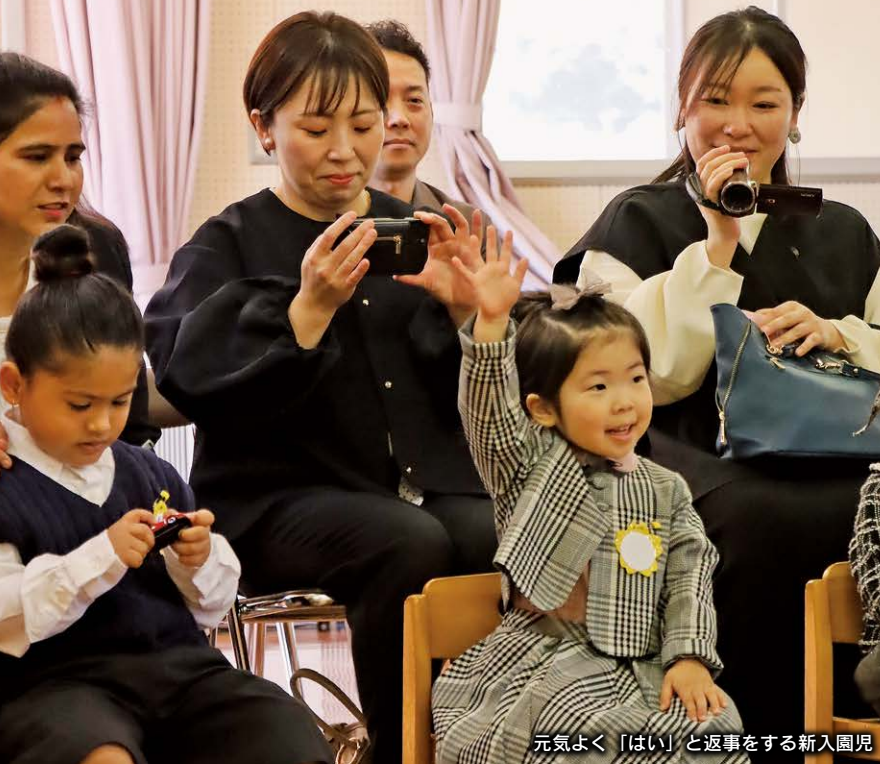
元気よく「はい」と返事をする新入園児