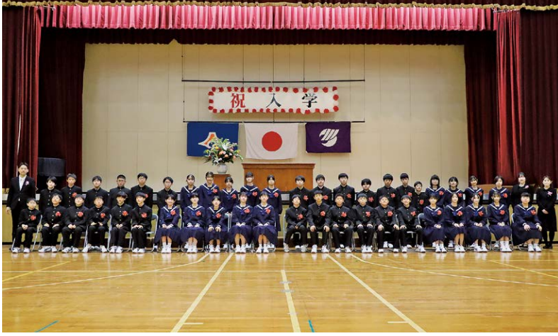
新生活、いよいよスタート（河津中学校 入学式）