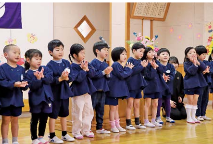
年長組から歌のプレゼント

入園式の最後には年長組園児による『チューリップ』の歌が披露され、さくら幼稚園の仲間となった園児を歓迎しました。新しく出会ったお友達とのどきどきわくわくの園生活が始まります。