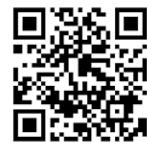
▲日本防火・防災ホームページ