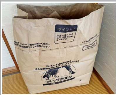
▲古い洋服は捨てずにリサイクルで、世界の子どもたちのためのワクチンへ