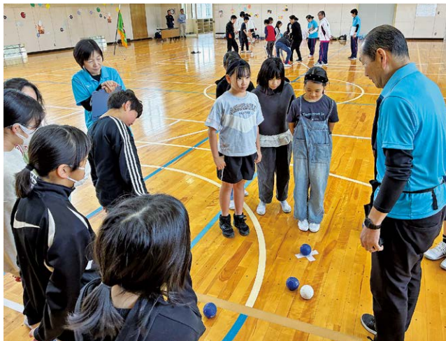
ボッチャに挑戦する団員

町内の小学4～6年生が参加する「河津ふるさと緑の少年団」入団式が4月25日、河津小学校体育館で行われ、新たに23人が入団しました。入団式後には、河津町スポーツ推進委員によるボッチャ体験が行われました。団員たちはチームに分かれ、声を掛け合いながら、競技を楽しみました。今後はキャンプや自然体験活動なども予定されています。