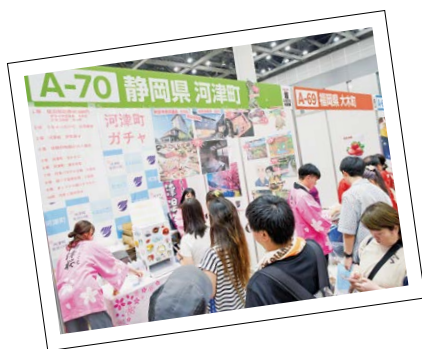
楽天超ふるさと納税祭の様子

行いました。返礼品を検索した際に、ページの上部に出やすくなるような仕組みの広告で、年末を中心に広告を經由して多くの寄附が集まりました。また、桜まつり会場でもふるさと納税のPRを行い、この場で河津町の返礼品をブックマークに登録していた人もおり、観光で訪れた人に向け、知ってもらう機会となりました。