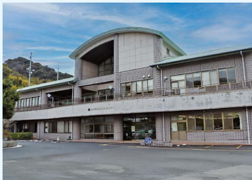
▲広域避難所としても活用される河津町保健福祉センター