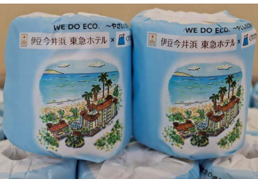
オリジナルの包装紙を巻いたトイレットペーパー