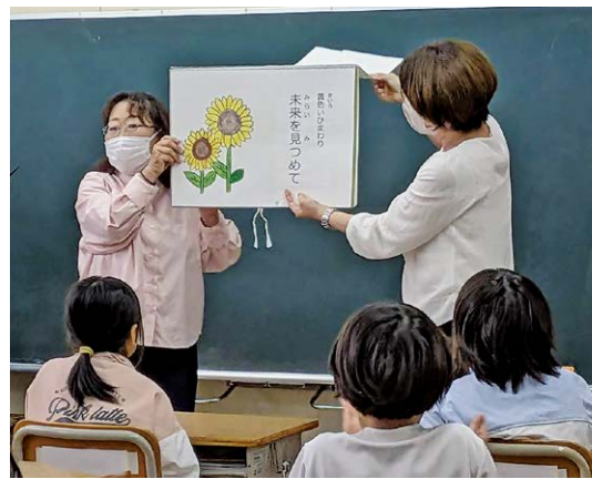
▲人権擁護委員の説明を熱心に聞く児童

人権擁護委員による「人権の花ひまわりの種贈呈式」が5月1日、河津小学校にて行われました。「人権の花運動」は「人権の花」であるひまわりを協力し合って育てることで、生命の尊さや思いやりの心を育んでもらおうという活動です。3年生へひまわりの種が贈られ、人権擁護委員から人権の花について説明を受けた児童たちは友だちと仲良くする大切さを学びました。