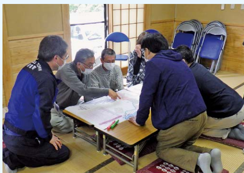
▲土砂災害出前講座で近隣住民と周辺環境を確認