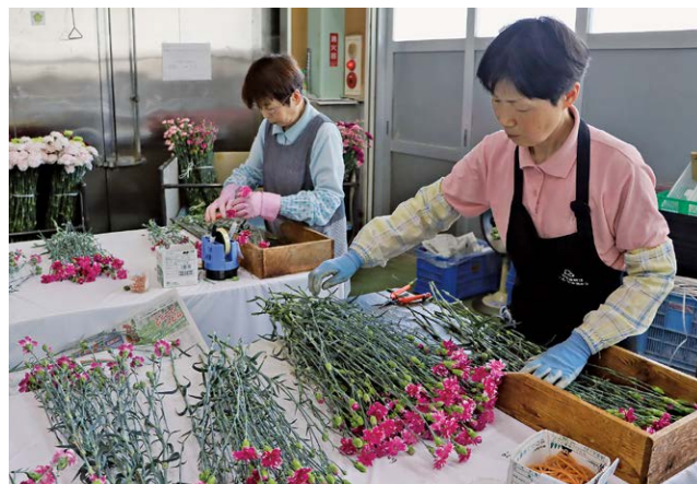
カーネーション出荷作業の様子