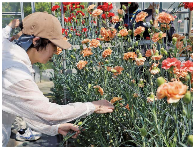
カーネーションの引き抜きに専念する参加者

河津温泉旅館組合主催の援農ボランティアツアー「カーネーション引き抜き農業体験」が5月11日から15日にかけて行われました。期間中、町内外から約120人がボランティアに参加し、新苗への植え替えのためカーネーションの引き抜きを手伝いました。引き抜いたカーネーションは持ち帰ることができ、色とりどりのカーネーションの引き抜きを楽しみました。