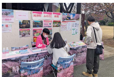
河津桜まつり会場でのPR活動

寄附額1億7000万円を 目指し、広告やイベント出展 を通じたプロモーションの強 化、既存返礼品のバリエーショ ン多様化などに力を入れ、ふ るさと納税寄附者に知ってい ただけるように努めていきま す。