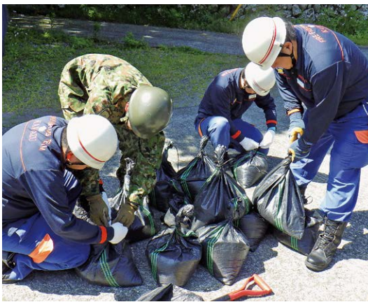
▲土のう作りに励む団員

河津町消防団は水防訓練を5月10日、縄地川河口付近で行いました。例年台風や雨量の多くなる時期に合わせて開催されています。訓練当日、消防団員47人が参加し、陸上自衛隊第34普通科連隊重迫撃砲中隊隊員の指導のもと、土のう作りを行いました。参加した消防団員はスコップを使って砂を袋に詰め、土のうを作ると、水害などの災害発生時に対応するために、隙間なく確実に重ねる方法などを指導を受けながら学びました。