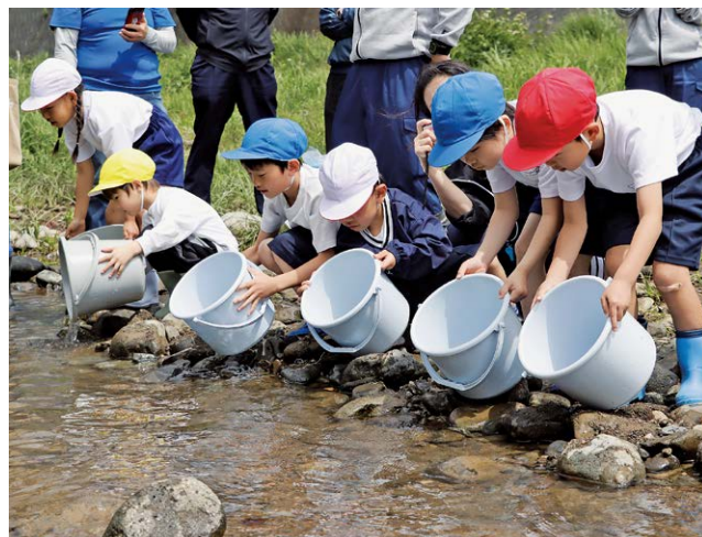
優しく声をかけながらアユを放流