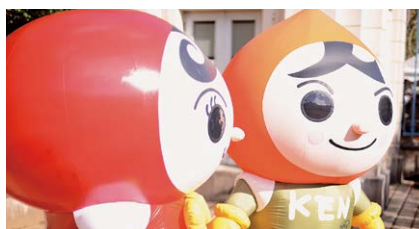
人KENあゆみちゃんと人KENまもる君

とき 7月1日(水) 10時～15時 ところ ふれあいホール ☎ 町民生活課 ☎34-1932