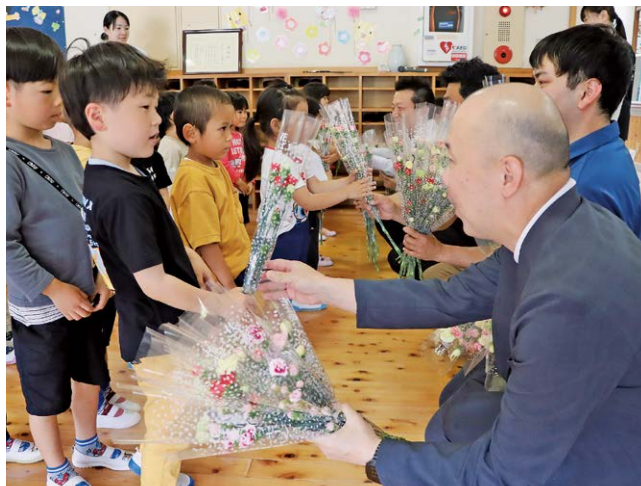
カーネーションを受け取る園児たち

河津町花卉組合は5月8日、「母の日」を前に、さくら幼稚園の園児たちにカーネーションの花を贈りました。この活動はカーネーション産地のPRや普及を兼ねて、毎年行われており、同組合カーネーション部会員が「おうちに帰ったら、おかあさんにいつもありがとうと言って渡してください」とあいさつした後、園児全員に花束を手渡しました。