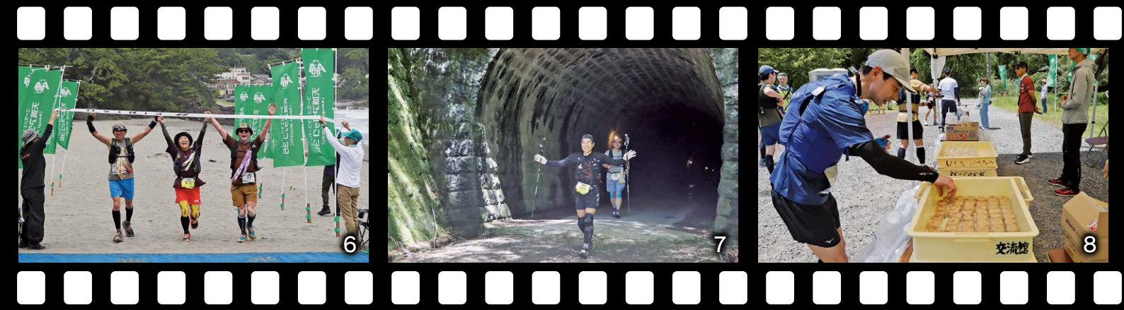
1_ゴールを目指してスタートを切る選手 2_ワサビメダルを手にとり完走を喜ぶ 3_踊り子Tシャツでレースに挑む 4_坂道を駆け抜ける 5_エイドで水分補給 6_笑顔でゴール! 7_天城トンネルを笑顔で通過 8_温泉まんじゅうエイドで糖分補給