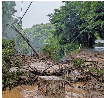
土砂崩れによって倒れた電柱