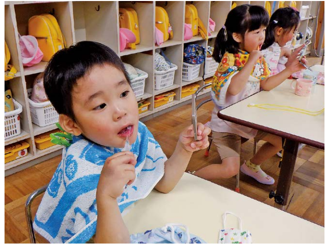
手鏡を使っていないに歯を磨く園児