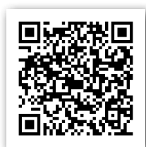
▲厚生労働省ホームページ