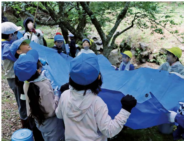
みんなで協力して梅を採る

河津小学校3年生は6月2日、湯ヶ野山梅林で旧西小学校から続く梅採りを行いました。児童たちは先生が落とした梅をブルーシートで受け止め収穫しました。勢いよく落ちてくる梅に当たらないよう児童は歓声をあげながら、手際よく梅を集めました。「こっちにたくさんあるよ」と声をかけ、力を合わせて作業に取り組み、にぎやかな声が梅林に響きました。