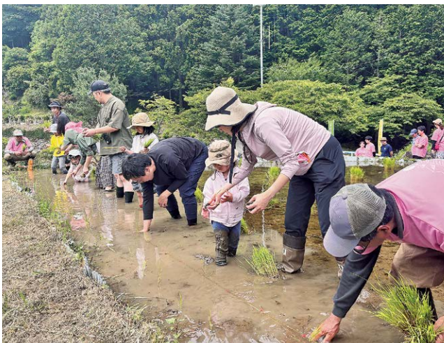
慣れない土の感触に盛り上がる参加者

都市と農村交流事業「農村体験ツアー」が6月14日、逆川区で行われました。渋谷区民35人が参加し、さかさかわ実りの里組合員の指導のもとサツマイモの苗付けと田植えを行いました。作業終了後には餅つきと餅のふるまいも行われ、参加者は普段の生活では味わう機会のない体験を楽しみました。10月には稲刈り、サツマイモの収穫体験を予定しています。