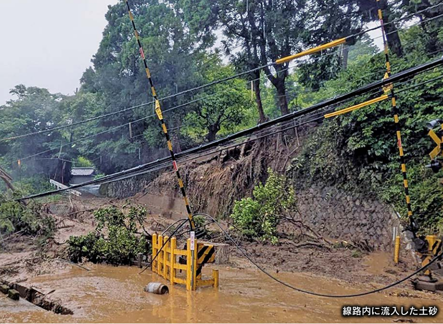
線路内に流入した土砂

6月3日の明け方から伊豆半島付近を通過した台風6号。役場の雨量計では1時間当たりの降水量が最大54ミリ、累計297.5ミリを記録する大雨に見舞われました。見高浜地区では土砂崩れが発生し、町道や伊豆急行線の線路内、民家に流入するなどの被害を受けました。この土砂崩れの影響で、伊豆急行線では片瀬白田駅 - 伊豆急下田駅間で運転を取りやめ、バスによる代行輸送を行うなど通勤、通学にも大きな影響が出ましたが、7日に運転を再開しました。