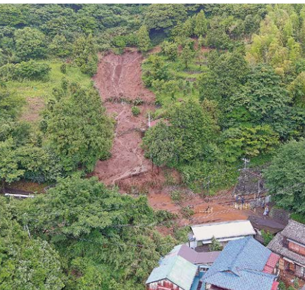
見高浜地区土砂崩れ