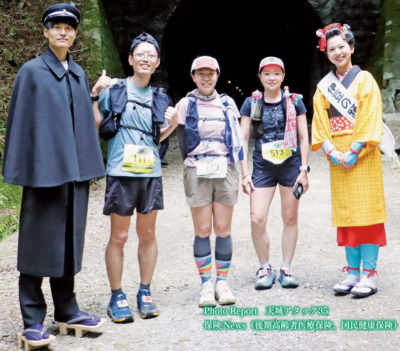
Photo Report 天城アタック35