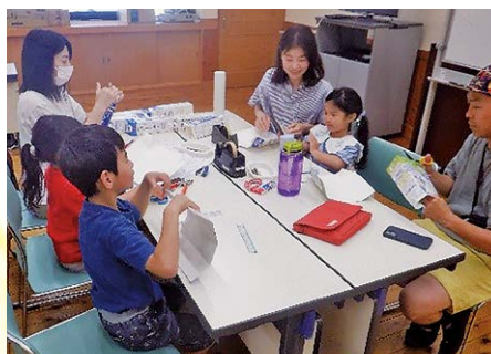
▲親子で楽しく作業中

親 子体験教室にこここファミリークラブ「ペーパークラフト教室」が5月30日、町立文化の家で行われ、16人が参加しました。