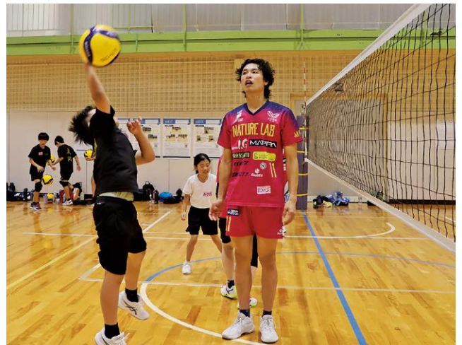
山田選手から直接アドバイスを受ける

歯と口の健康週間に合わせてむし歯予防教室が6月2日、さくら幼稚園で行われました。園児たちは歯科衛生士から歯を守るために規則正しい生活の大切さや歯の磨き方のポイントを教わりました。その後、園児たちは、染め出し液で紫色に染まった歯の磨き残しを鏡で確認しながら、歯ブラシでいないに歯磨きをしていました。