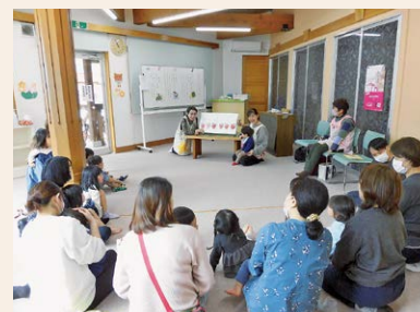
▲おはなし会を20年間続けてくださった奥井先生、ありがとうございました！