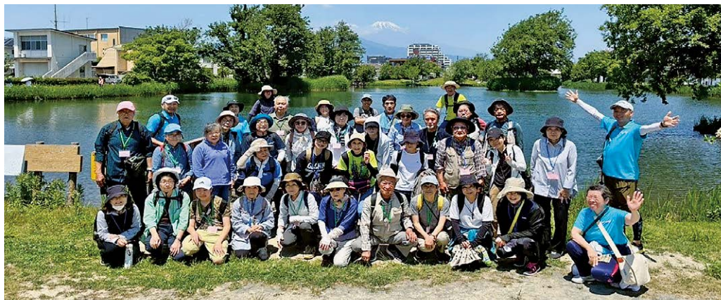
▲自然を満喫したハイキング