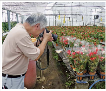
▲ふるさと納税返礼品を撮影する様子