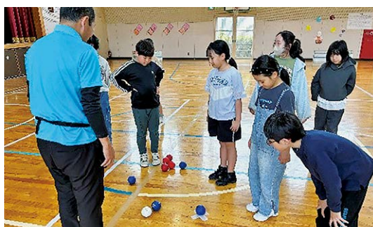
▲ポッチャを楽しむ団員

団員らは、今後キャンプや七滝巡りなどの活動を通して自然に触れあい、仲間との交流を深めながら、さまざまな体験活動を行います。