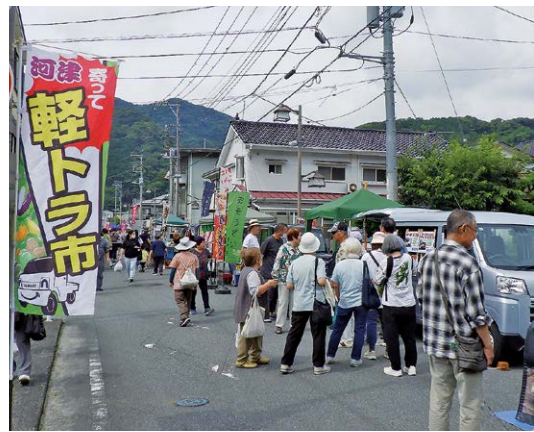
▲来場者でにぎわう会場