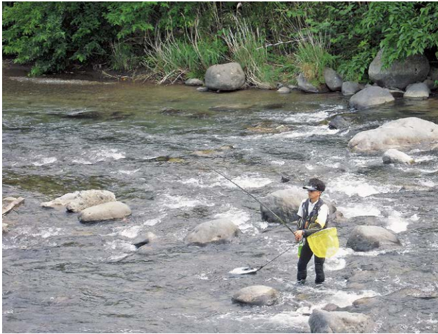
アユ釣りを楽しむ釣り人

河津川では6月7日、アユ釣りが解禁されました。解禁を待ちわびた釣り人たちが川へ繰り出し、竿を並べて釣りを楽しみました。天然遡上のアユも見られ、遡上状況も良好とのこと。5月24日には河津川非出資漁協組合員による試し釣り、河川清掃も行われ、釣り人が河津川を訪れる準備をしました。天候が安定し、日照時間が増加することで釣果が期待できます。